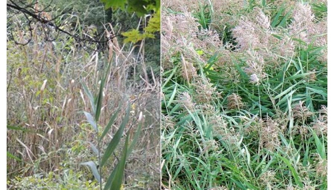
写真4 左:大沼浮島の沼岸、右:同時期の山形市内の河川敷

これを受けて、2011/10/7に再度比較した。大沼では枯死株が目立ち、穂もわずかである。写真手前に正常個体もあるので、枯死はアシの内因的なものではない。一方、他地区では出穂し、葉も青々としていた。