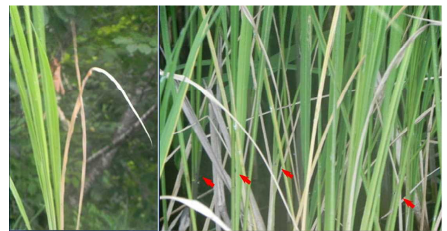
写真5 左:芯葉の枯れたアシ、右:産卵痕の様子

若白髪のように芯葉が枯れることは、茎の中で芯葉の付け根が食害された場合起こりうる。また、産卵痕をもつアシを採取した。ほぼ水平に産卵痕が並ぶ例も観察された。 写真5右