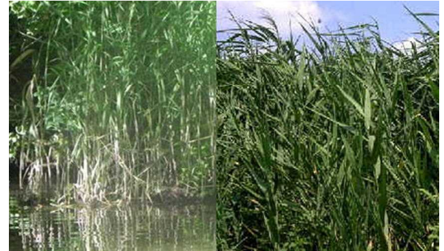
写真3 左:大沼浮島の沼岸、右:同時期の山形市内の河川敷

生まれて初めてボートに乗り観察した。真夏の日差しにアシは青々と茂り健康そうに見えたが、まとまって枯れている場所と、一部の若い葉に若白髪のような枯れ込みを見つけた。前者は他地区では観察されない。